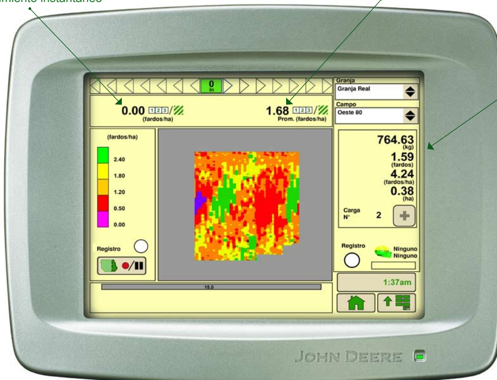
Pantalla táctil GreenStar 2™ 2600